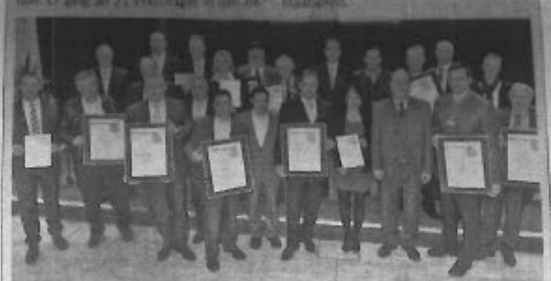
Die Gewinner des Bayerischen Staatspreises 2013.

Bayerischer Staatspreis Zeitgleich mit dem Bundespreis wurde auf der Internationalen Handwerksmesse auch der Bayerische Staatspreis verliehen. Er ging an 21 Preisträger in den verschiedenen Gewerke und Branchen.